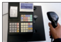
Connexion d'un lecteur code-barres