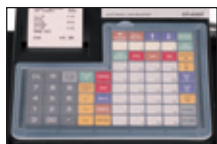
Clavier plat (F)

Clavier plat : nombreux articles en direct au clavier. Etanchéité (farine...) Clavier à touches : saisie rapide par code produit.