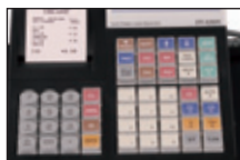
Clavier à touches (N)